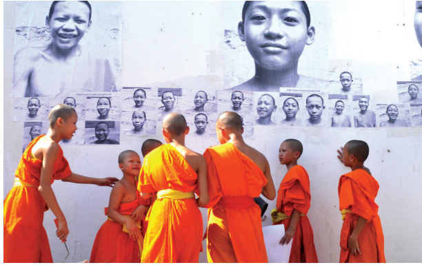
© Action Inside Out menée par Aline Deschamps. The Faces of Monastic Life, Chiang Mai, Thailand - insideoutproject.net

Installation et inauguration de l'exposition de photos de Suresnois. Avec la complicité de la librairie Lu & Cie. Programme complet des animations sur suresnes.fr